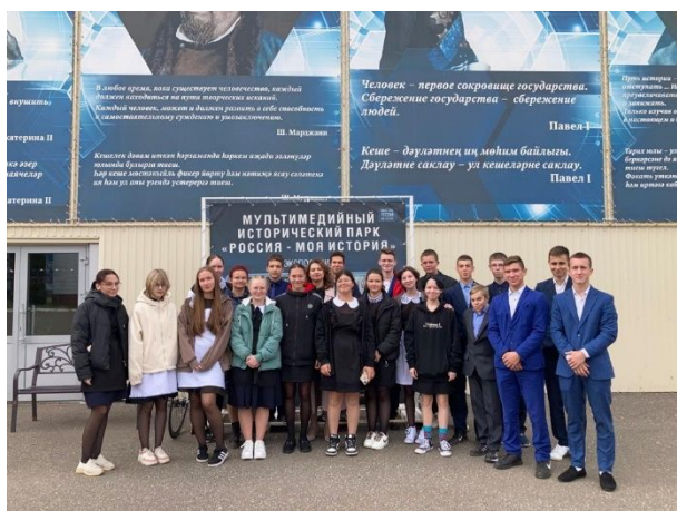
Экскурсия в исторический парк «Россия-моя Родина»