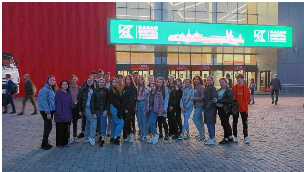
Экскурсия в Экспо центр Kazan Digital Week