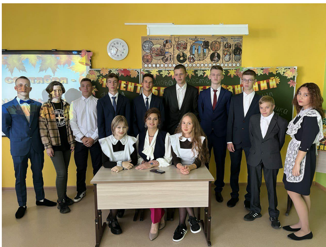
Мой любимый 10 класс!