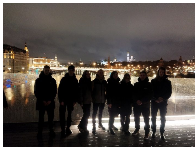
Поездка в Москву