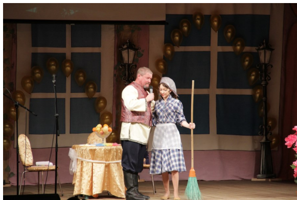
Трогательная сцена встречи дочери с отцом

Зрители получили большой заряд положительных эмоций