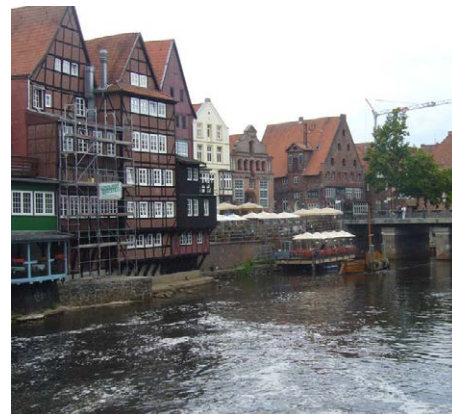
Река Ильменау в Лüneбурге (Германия)

В первое своё путешествие я отправилась в три года. Это был мой первый полет на самолёте, и я была очень рада такому необычному событию в моей жизни. Мне очень понравилось в Турции. Там я в первый раз искупалась в море и насладились этим чудесным чувством легкости и покоя. После