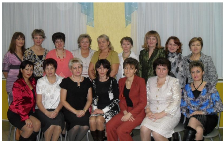
Коллектив педагогов МБДОУ №16 «Сказка», 2015 год

Сегодня мы, конечно, говорим огромное спасибо тем людям, кто стоял у самых истоков. Это ветераны педагогического труда, посвятившие свою жизнь воспитанию подрастающего поколения.