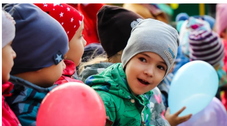
День знаний, 2018 год

Многое изменилось за прошедшее время. Учреждение приобрело индивидуальность, прошло длинный путь повышения качества работы, улучшилась материально-техническая база нашего детского сада.