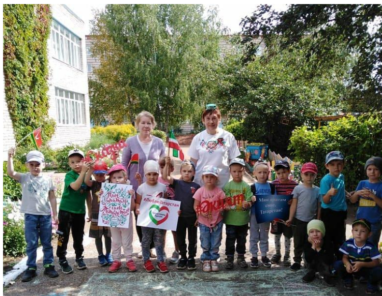
День Республики Татарстан, 2020 год

Пожелаем же нашему детскому саду успехов, удач и благополучия еще на многие-многие годы.