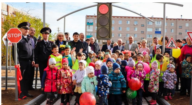
Открытие «Автогородка», 2019 год

Детский сад имеет свои замечательные традиции. Мы воспитываем детей в духе нравственности, патриотизма, любви к своему родному краю, уважения старшего поколения, своей семьи и семейных ценностей. В детском саду проходят поэтические, музыкальные творческие вечера, спортивные состязания, ПДД-квесты, семейные, экологические праздники и акции.