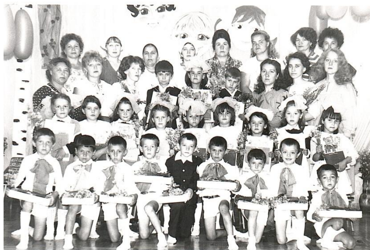
Первый выпуск ясли-сада №16 «Сказка», 1986 год

35 лет – для истории всего лишь миг, а для многих поколений выпускников, воспитателей – это незабываемое событие, которое дарит прекрасные воспоминания о ярких буднях и открывает новые страницы творческой деятельности.