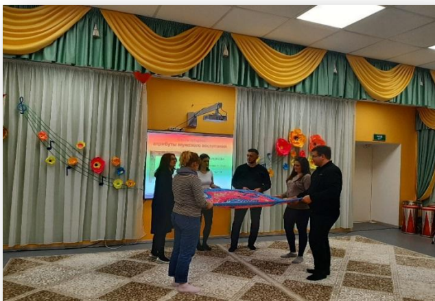
Совместное мероприятие с АНОО “Центр образования ”Егоза”. Родительский всеобуч “Мама и папа в судьбе ребенка”