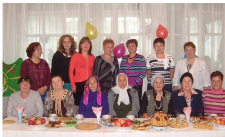
Чествование ветеранов на День пожилых, 2017 год

Многое изменилось за эти годы, но неизменным осталось трепетное, бережное отношение к каждому ребёнку, энтузиазм, добросовестность, инициатива и искренняя заинтересованность сотрудников. Коллектив детского сада — это коллектив единомышленников, который трудится по принципу единой педагогической команды. Главным условием работы персонала является любовь к детям и желание подарить им радость, знания и частичку души.