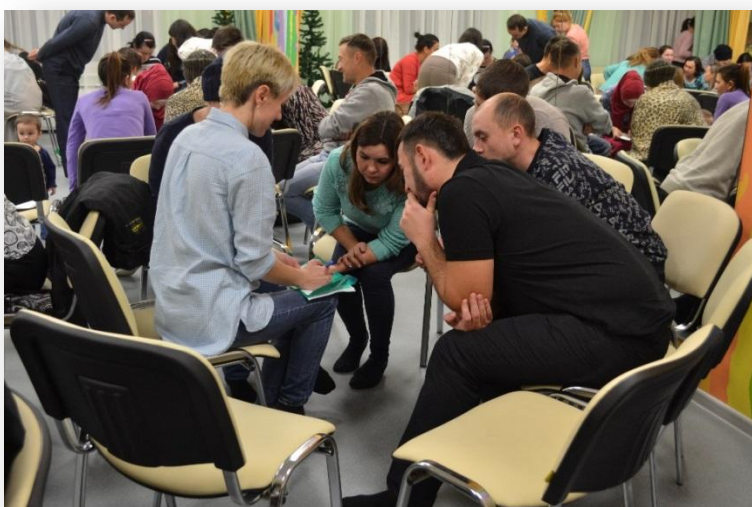
Квест-игра “Путешествие по океану здоровья”