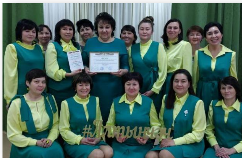
Опыт работы МБДОУ «Детский сад №10 «Алтынчеч» г.Азнакаево по обучению детей родному (татарскому) языку

Гаизиз туган телебез – татар телен кадерлик, яклайк, саклайк!