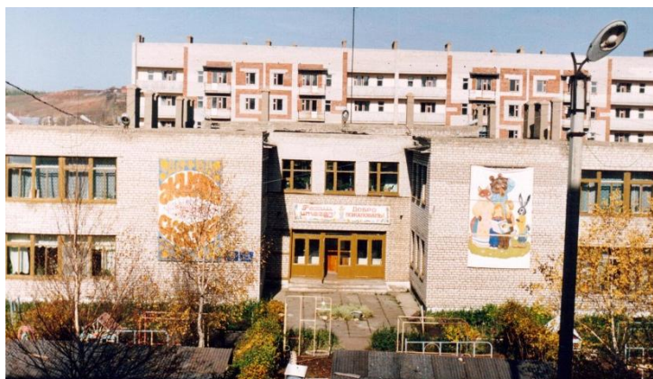
Ясли сад №16 «Сказка» г.Азнакаево, 1987год

Тридцать пять лет прошло с того дня, как впервые распахнулись двери детского сада №16 "Сказка" в городе Азнакаево, и в его стенах зазвучали детские голоса. Выпускники нашего образовательного учреждения давно стали взрослыми людьми, но и, как 35 лет назад, значительная их часть спешат сюда— уже со своими детьми.