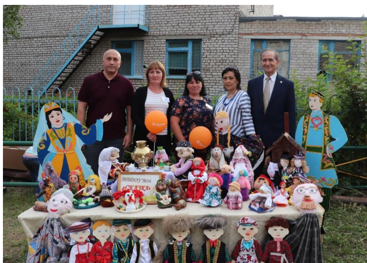
На празднике двора, 2019 год

Работа в детском саду невозможна без участия в ней родителей. Педагоги и родители – партнеры в общем важном и нелегком деле – воспитании детей. Наши отношения складываются на основе взаимоуважения, доброжелательности, сотрудничества. Мы благодарны мамам и папам, бабушкам и дедушкам, которые активно участвуют в жизни нашего учреждения. Ведь дети – наше будущее. И именно от сотрудничества семьи и детского сада зависит, будет ли оно счастливым и гармоничным. Какие «плоды» мы вырастим, такие и соберем. Наш девиз: «Учение без принуждения, учение с увлечением».