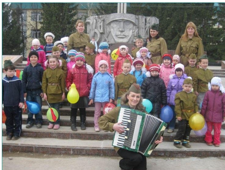
Экскурсия к Вечному огню на День Победы, 2015 год

Работа в детском саду невозможна без участия в ней родителей. Педагоги и родители – партнеры в общем важном и нелегком деле – воспитании детей. Наши отношения складываются на основе взаимоуважения, доброжелательности, сотрудничества. Мы благодарны мамам и папам, бабушкам и дедушкам, которые активно участвуют в жизни нашего учреждения. Ведь дети – наше будущее. И именно от сотрудничества семьи и детского сада зависит, будет ли оно счастливым и гармоничным. Какие «плоды» мы вырастим, такие и соберем. Наш девиз: «Учение без принуждения, учение с увлечением».