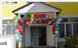
МАДОУ Детский сад № 8 "Теремок"

Заходи в наш Теремок, Ярко светит огонек, И лягушке, и мышонку, И лисичке, и зайчонку, И дочурке, и сыночку, Всем уютно в Теремочке