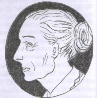
Рис. Куницыной Е.Б.

Мама: «Глубоко верю в честность своих детей»