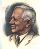
К.И.ЧУКОВСКИЙ 1882 - 1969

Результаты опубликованы на сайте http://centrideia.ru Всероссийское СМИ. Регистрационная запись ЭЛ № ФС 77-76118 от 12.07.2019 г. сделана Федеральной службой по надзору в сфере связи, информационных технологий и массовых коммуникаций