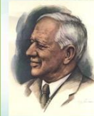
К.И.ЧУКОВСКИЙ 1882 - 1969

Результаты опубликованы на сайте http://centrideia.ru Всероссийское СМИ. Регистрационная запись ЭЛ № ФС 77-76118 от 12.07.2019 г. сделана Федеральной службой по надзору в сфере связи, информационных технологий и массовых коммуникаций