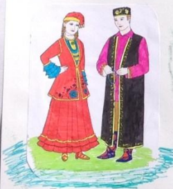
Польша Лехия Язык: польский