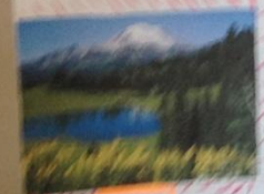
Озеро в горах

Вода в реках и озерах постоянно движется. Это движение называется течением. Оно возникает из-за разницы в уровне воды. Вода всегда течёт от более высокого уровня к более низкому.