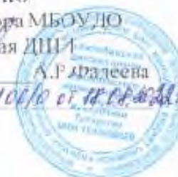
График образовательного процесса на 2022-2023 учебный год