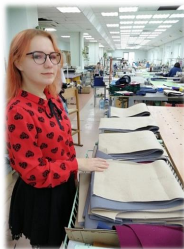
Практика на АО «Нижекамская швейная фабрика»