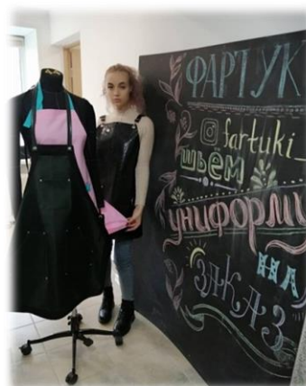
Студенты проходят практику и во многих других ателье города