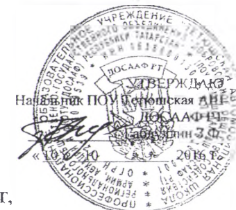
График работы закрытой площадки для вождения автомашин категории «В», «С ВУС-837», «СД» ПОУ Тетюшская АШ ДОСААФ РТ, категория «С» ГАОУ СПО «Тетюшский сельскохозяйственный техникум» на 2016-17 учебный год.

Полетная площадь асфальбетонного покрытия - 3600 кв. м