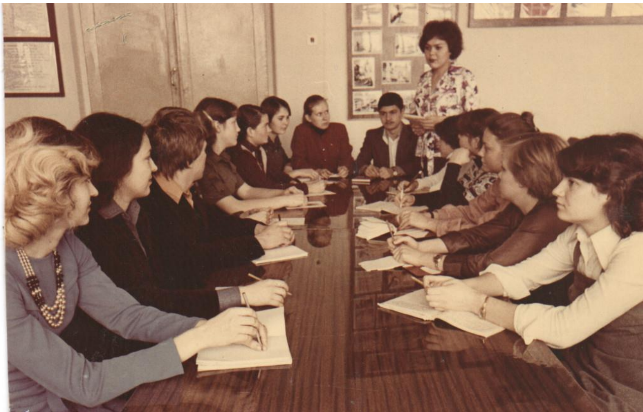
Комсомольское собрание. 1980-е годы.

В 1970-1980-е студенты техникума проходили практику на побережье Черного моря – выезжали на целое лето, где совмещали работу и отдых.