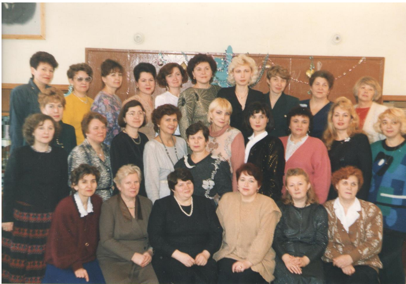
Коллектив Казанского торгово-экономического техникума в 1990-е г.