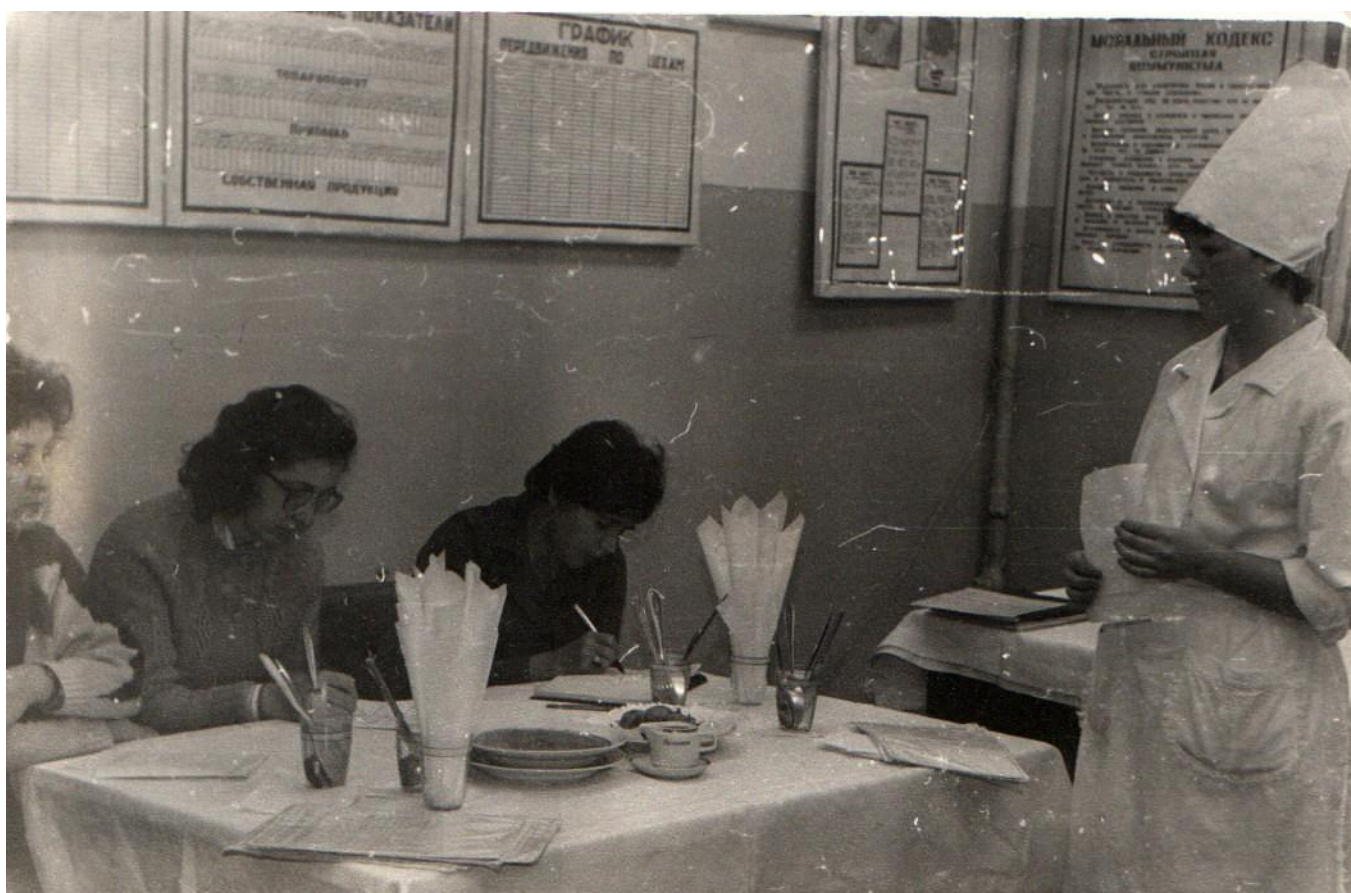
Члены жюри и участница конкурса по технологии приготовления пищи.