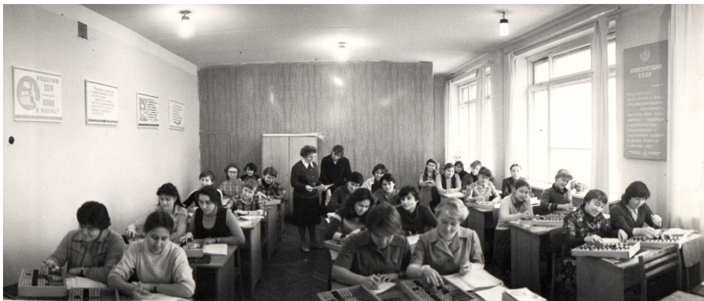
Занятие по бухгалтерскому учету. 1980-е.

В октябре 1981 году Казанский техникум советской торговли отметил 10-летие