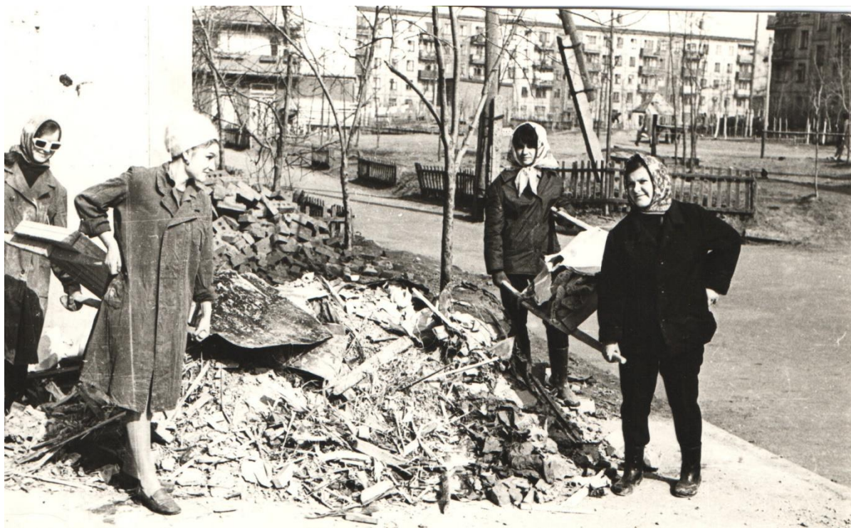
1971 год. Уборка здания и территории после строительных работ.