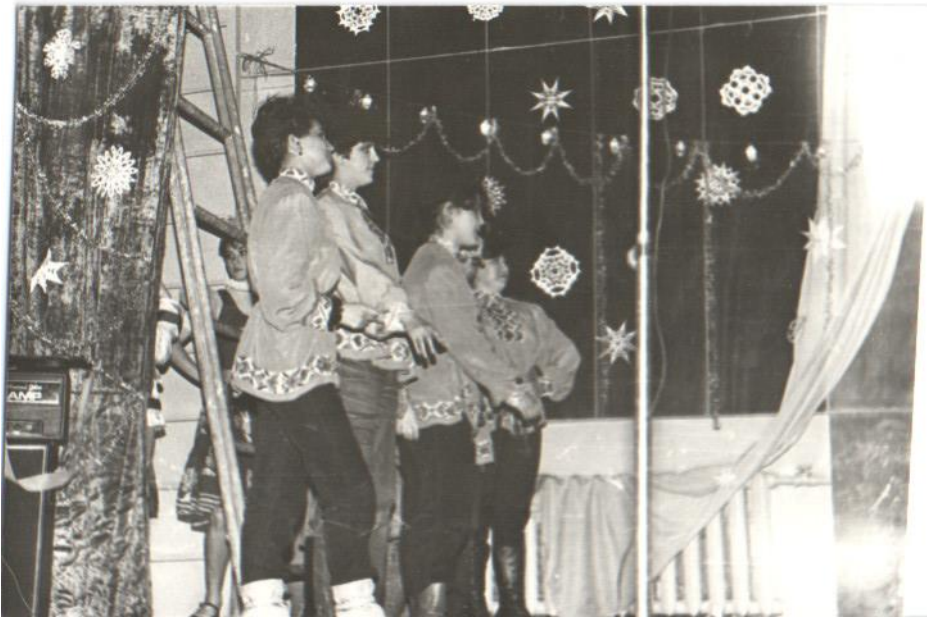
Творческие номера студентов.