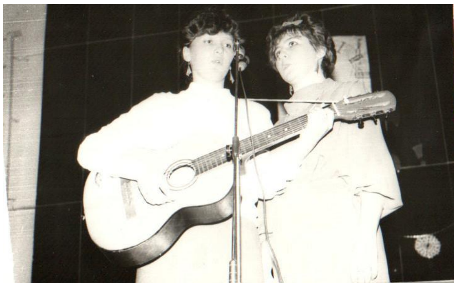
Творческие номера студентов

Организовывались экскурсионные поездки студентов в различные города СССР