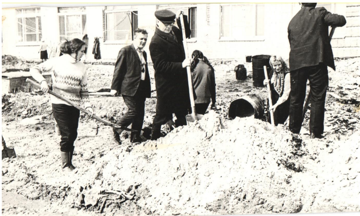
1971 год. Строительные работы.