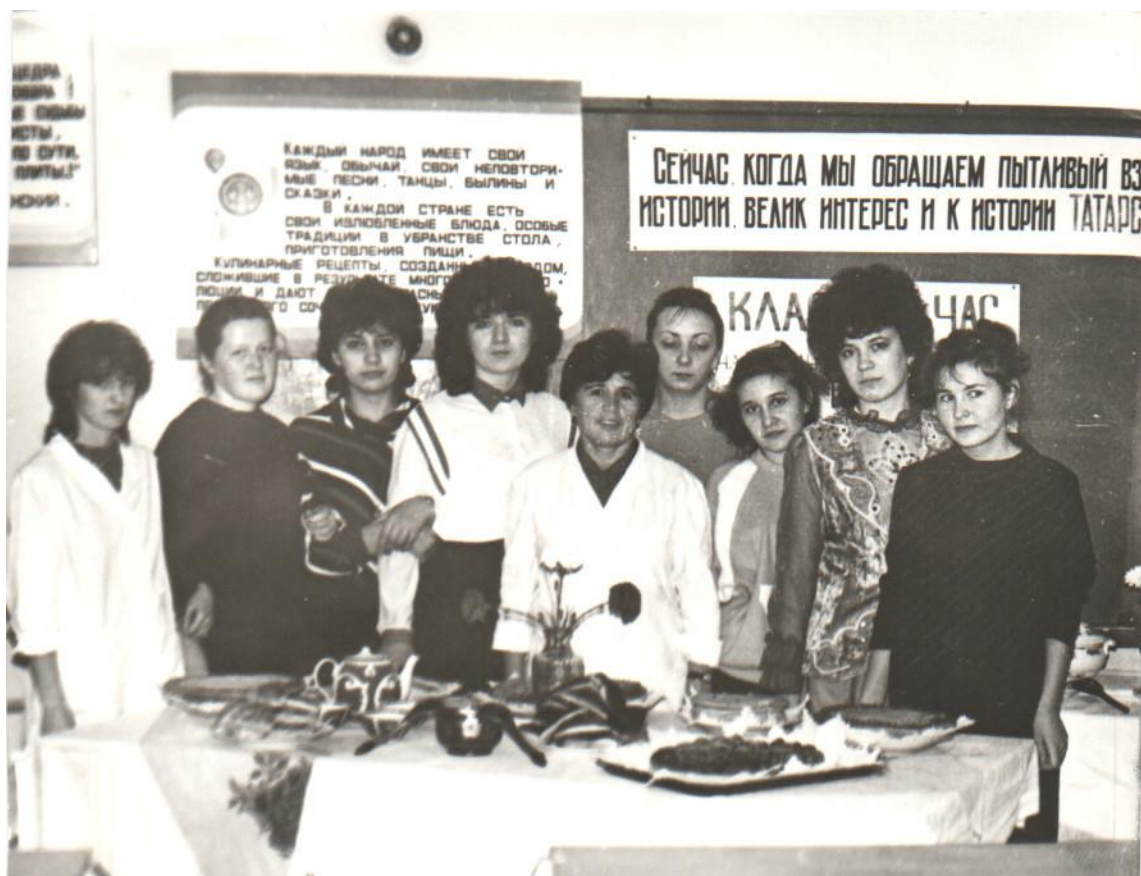
Тематический классный час.