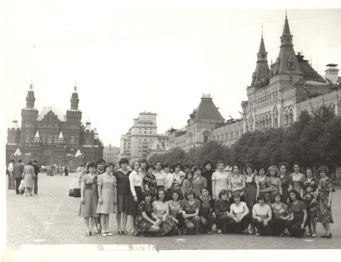
Студенты КТСТ на экскурсии в Москве

Организовывались экскурсионные поездки студентов в различные города СССР