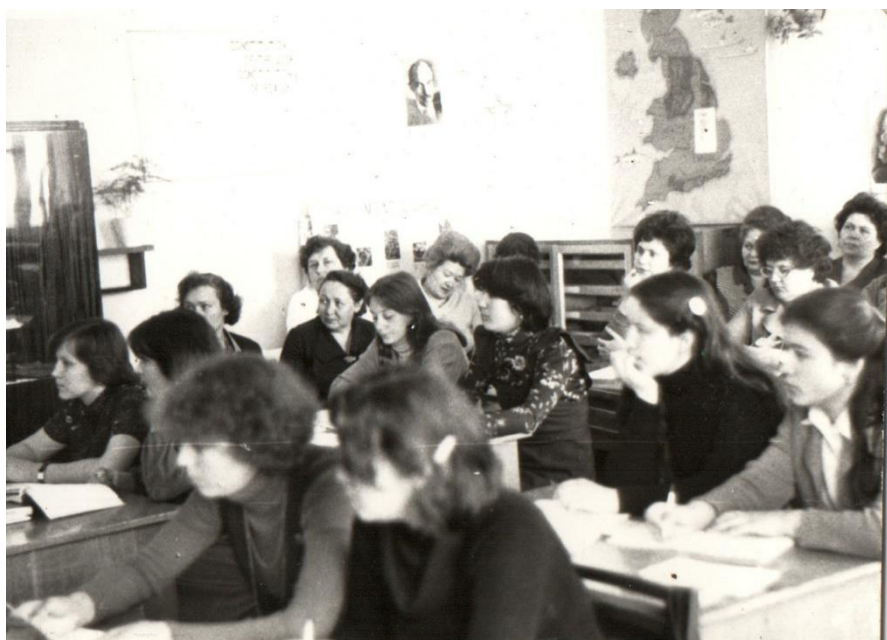
Открытый урок по иностранному языку. 1980-е.