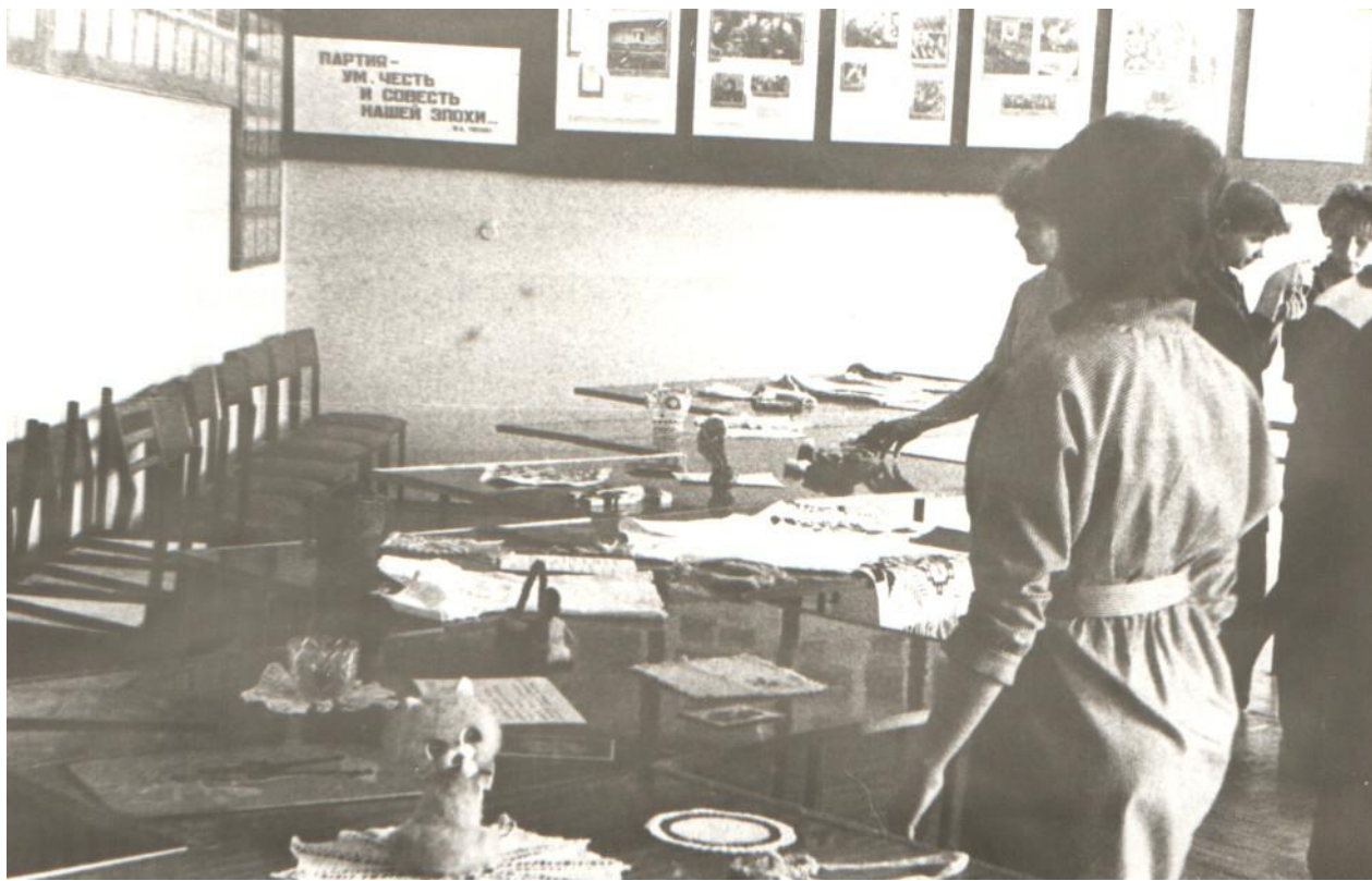
Выставка творческих работ студентов. 1987 г.