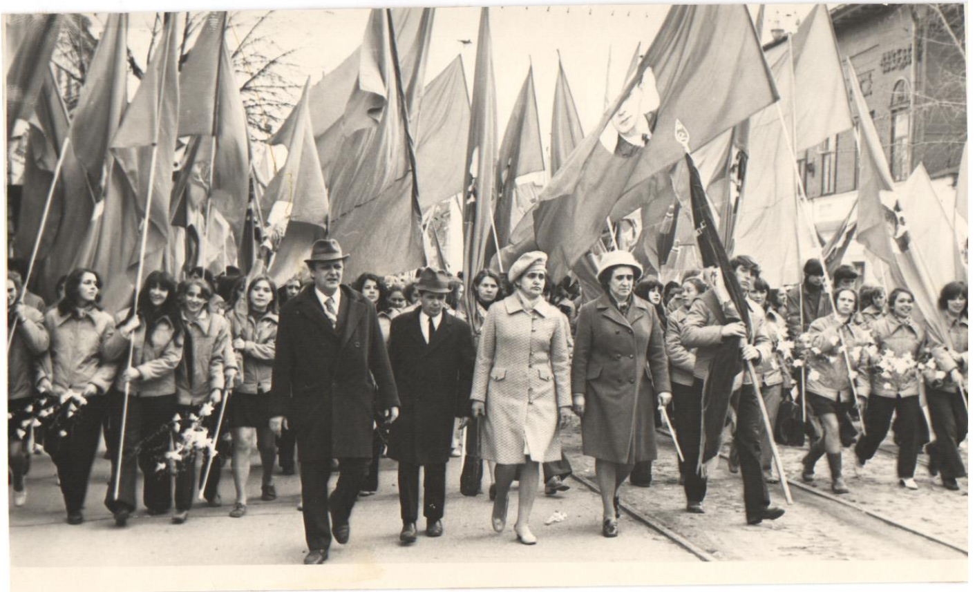
Первомайская демонстрация. 1972 год.