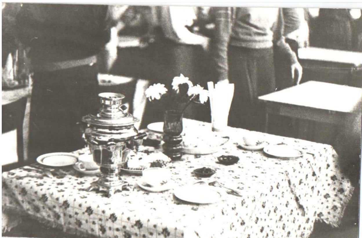
Выставка творческих работ студентов. 1987 г.