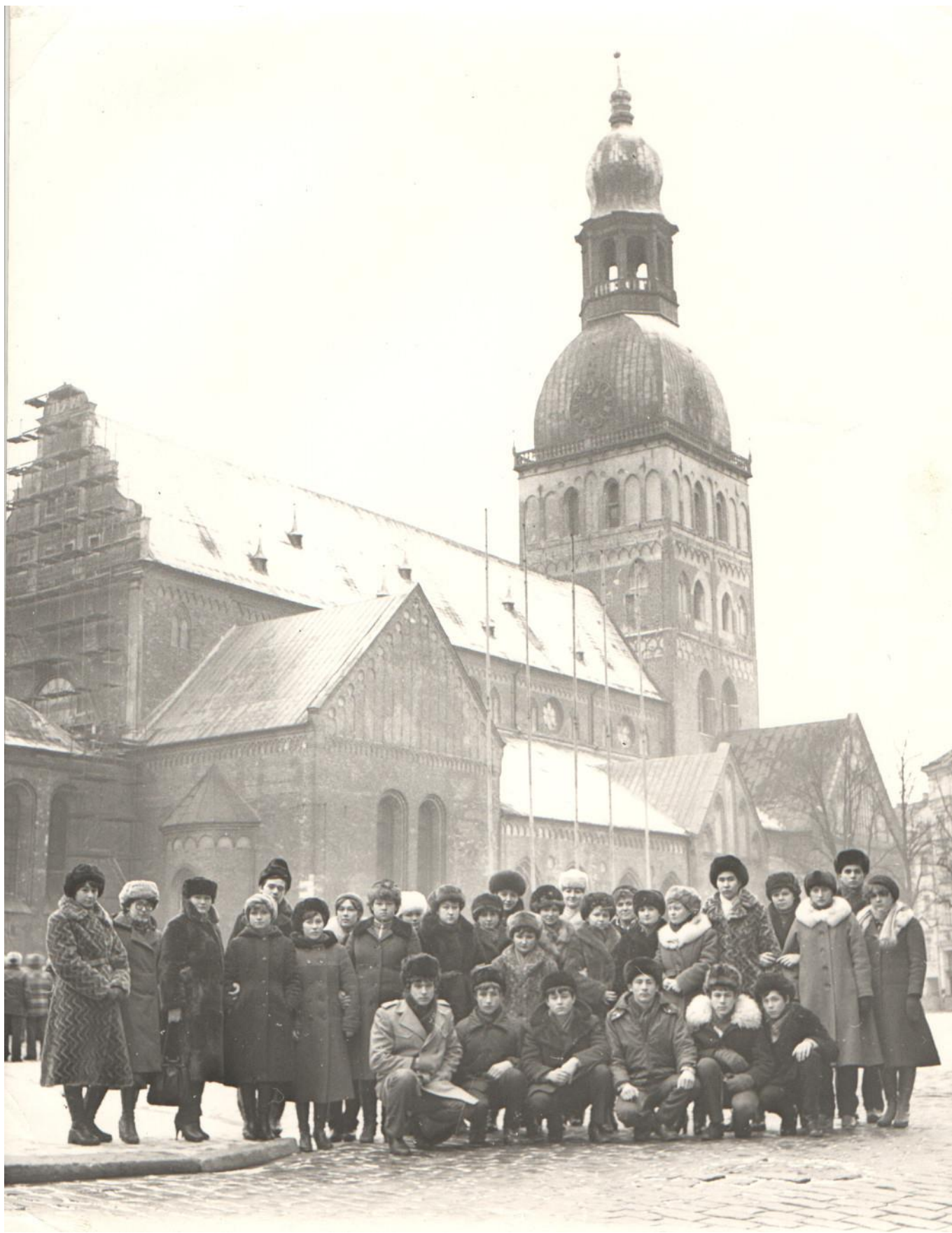
Студенты КТСТ во время поездки в Латвийскую ССР