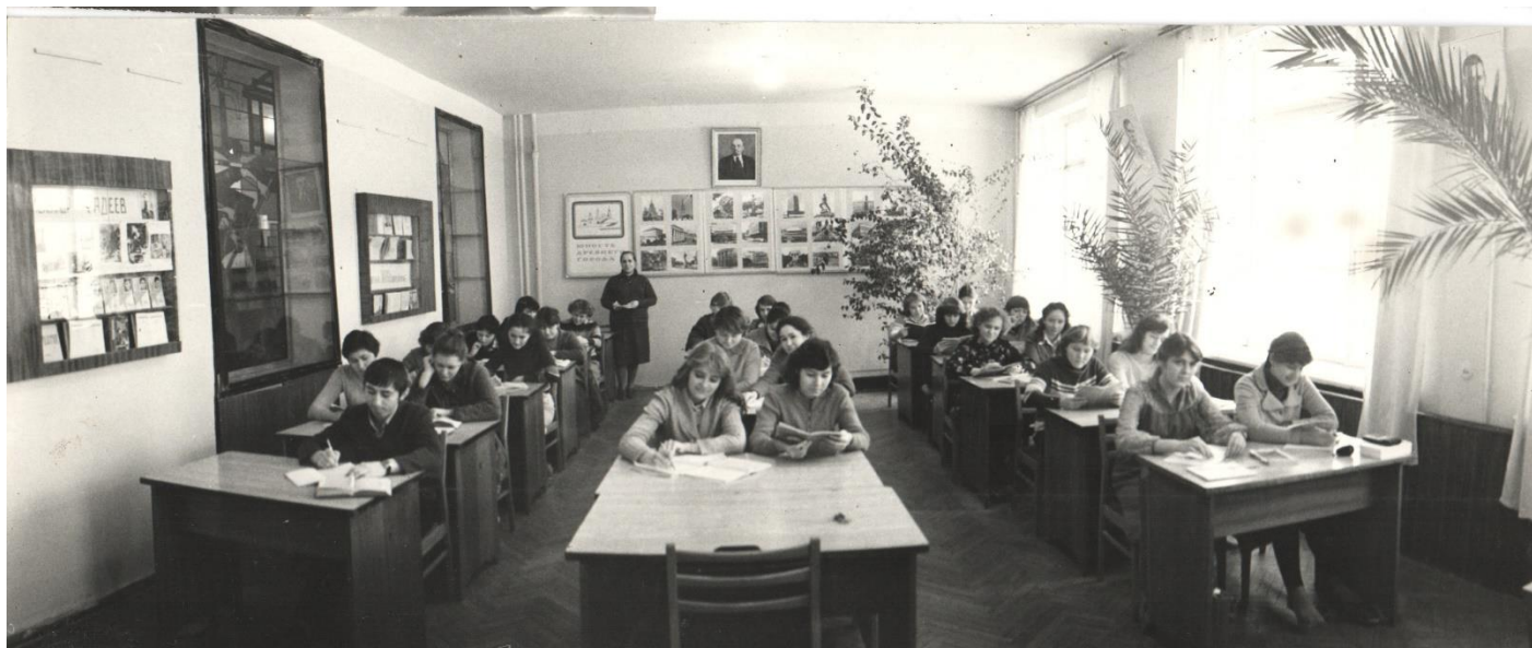
Читальный зал. 1980 г.