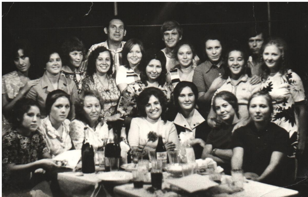
Студенты КТСТ на практике в Сочи. 1970-е.

Расширению кругозора, углублению знаний студентов способствуют различные виды внеклассной работы. Это выставки творческих работ студентов, кулинарные выставки, конференции, а также творческая самодеятельность.