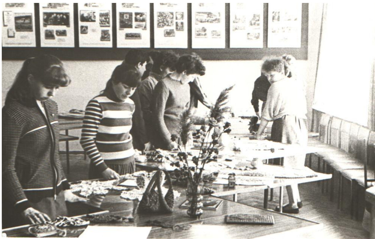
Выставка творческих работ студентов. 1987 г.