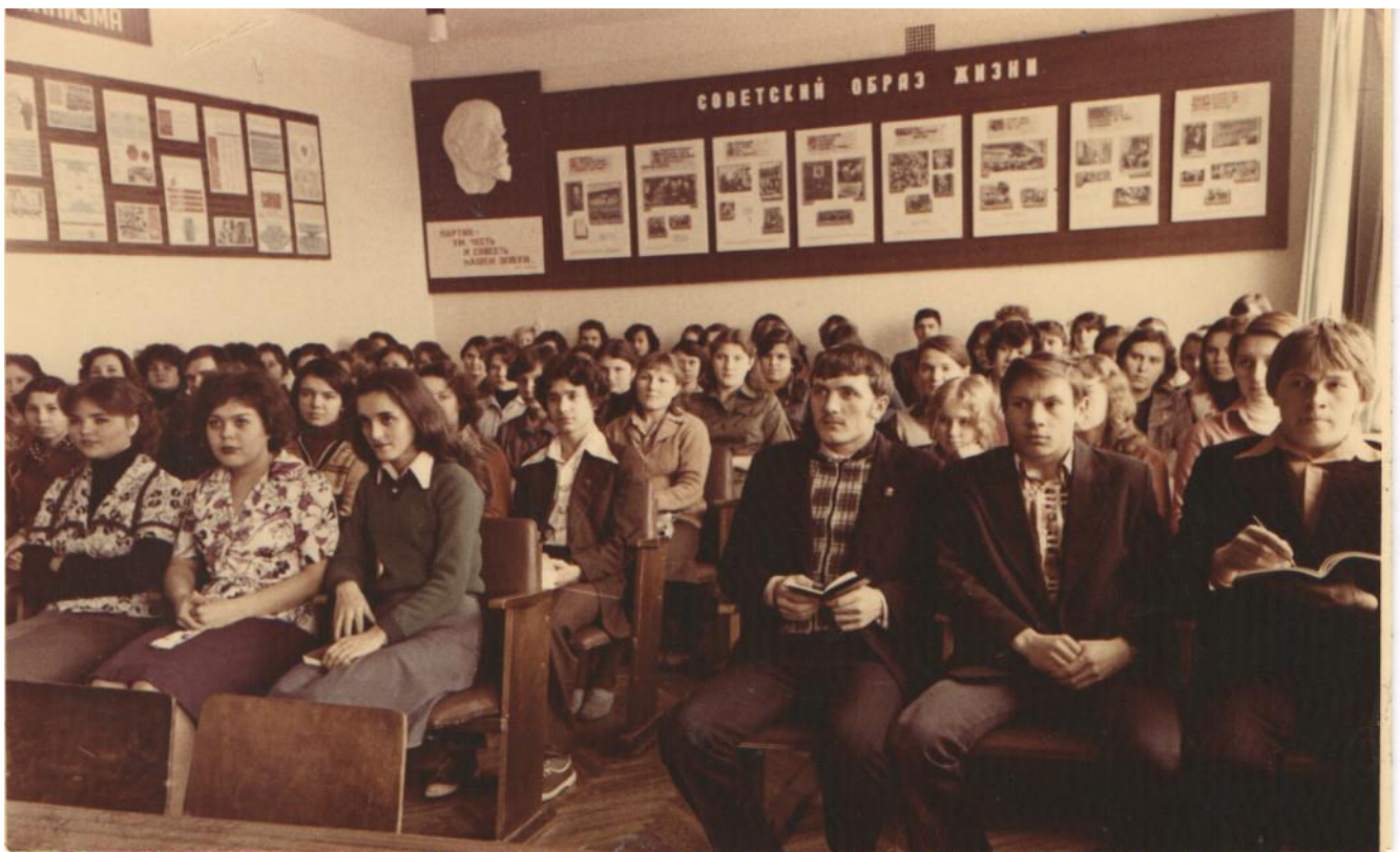
Комсомольское собрание. 1970-е годы