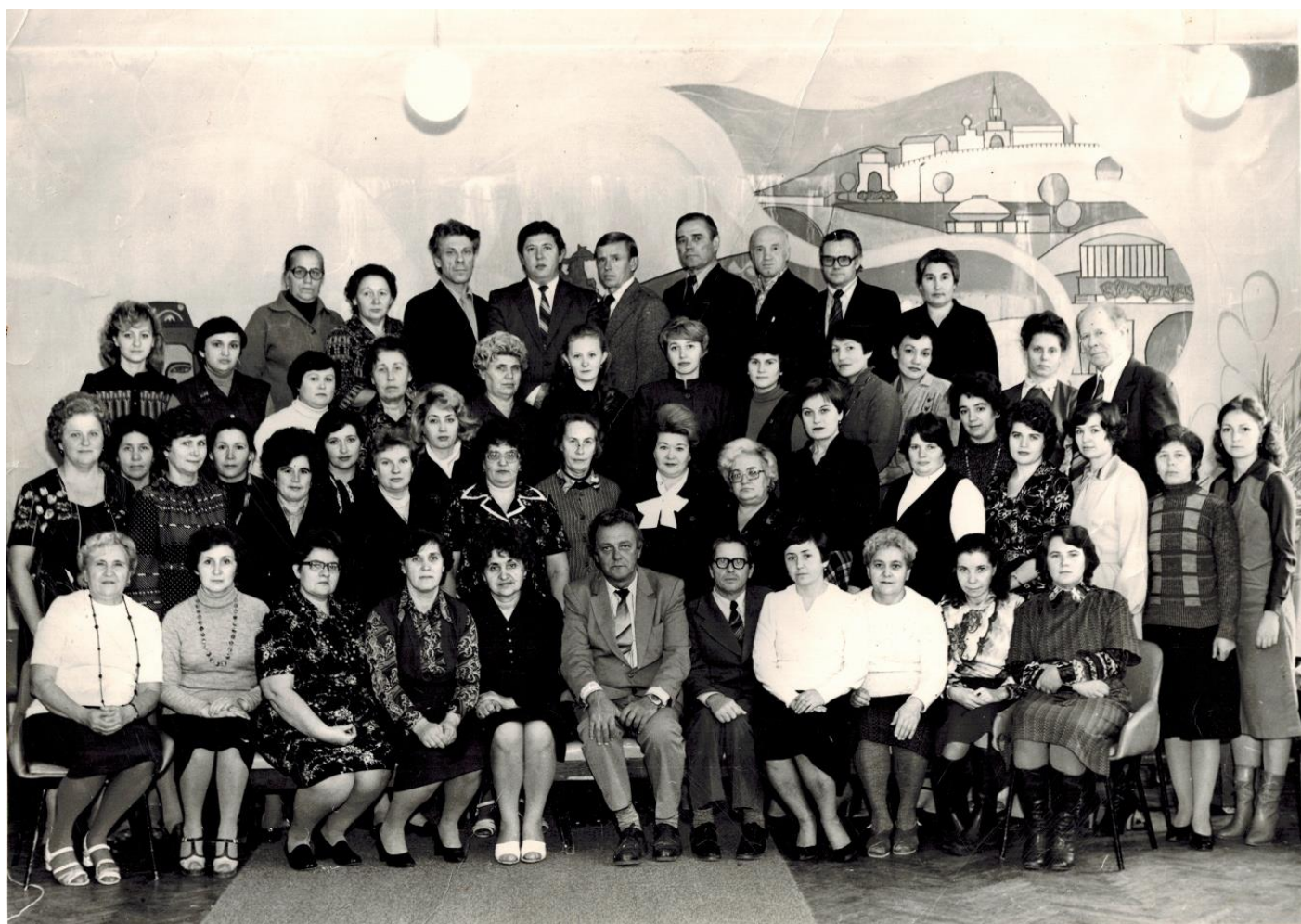
Октябрь 1981 года. 10-летие Казанского техникума советской торговли.

В октябре 1981 году Казанский техникум советской торговли отметил 10-летие