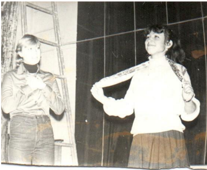
Творческие номера студентов