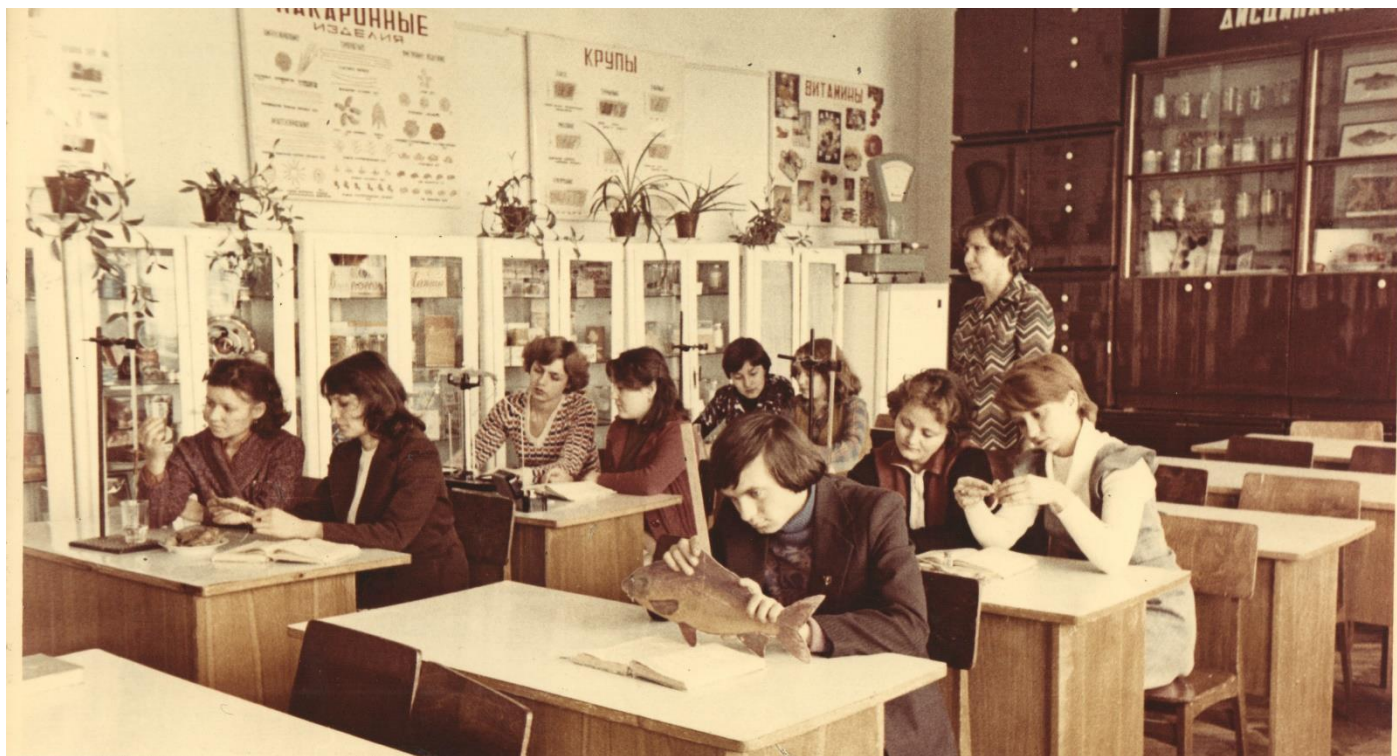
Занятие по товароведению. 1978 год. Группа 83ПС.