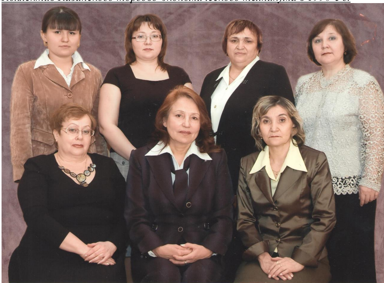
Преподаватели товароведно-коммерческого цикла