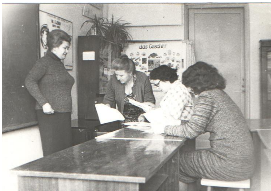
Заседание общеобразовательного цикла. 1970-е