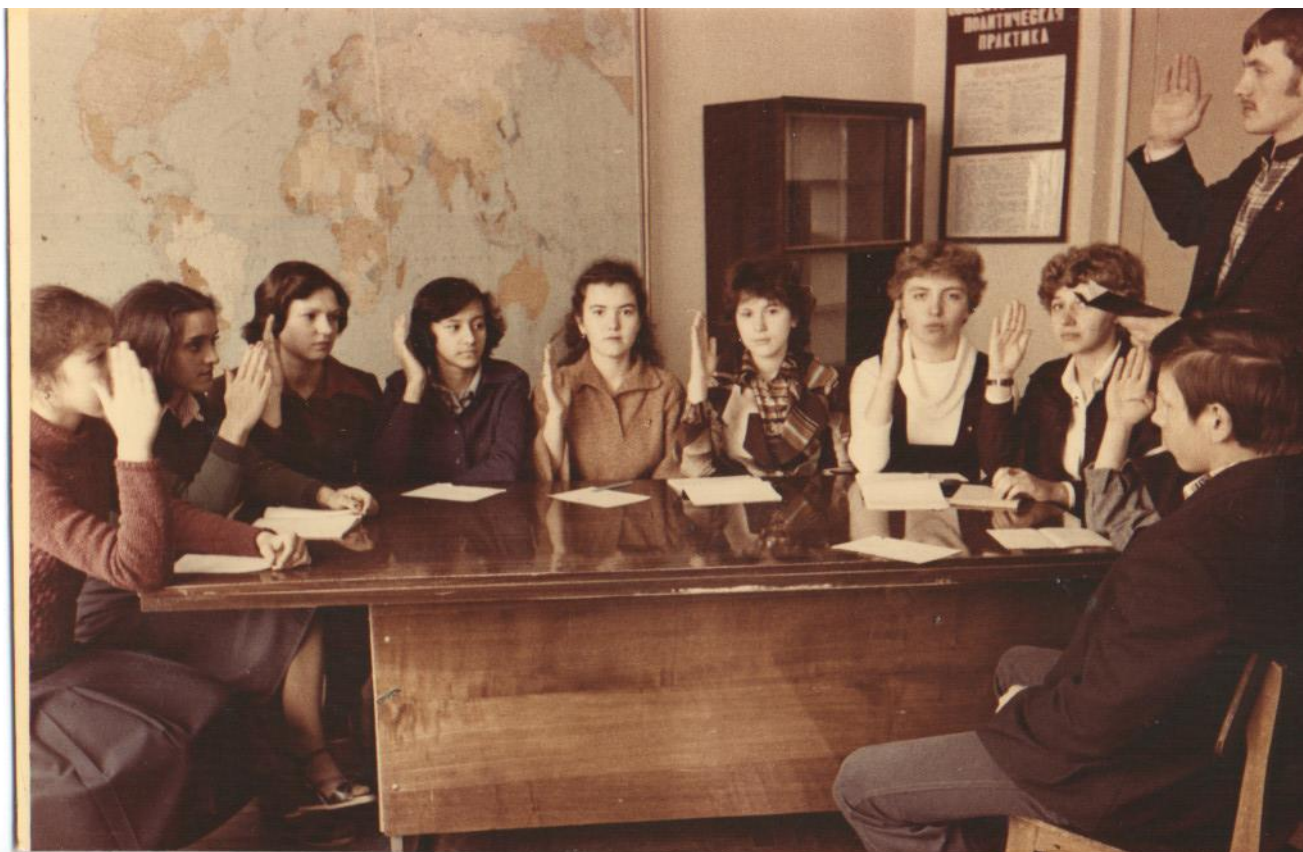
Заседание профкома. 1970-е