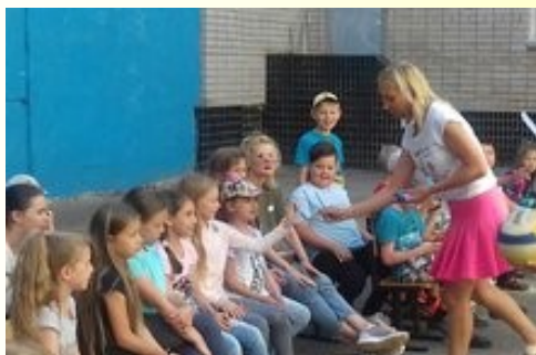
Перекресток семи дорог