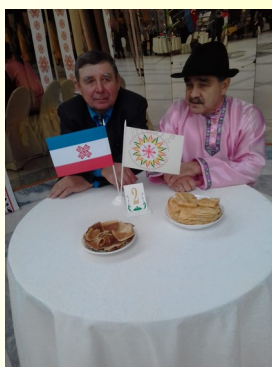
Мероприятие в городском доме культуры

4 ноября 1612 г. воины народного ополчения под предводительством Кузьмы Минина и Дмитрия Пожарского штурмом взяли Китай-город, освободив Москву от польских интервентов и продемонстрировав образец героизма и сплочённости всего народа вне зависимости от происхождения, вероисповедания и положения в обществе.