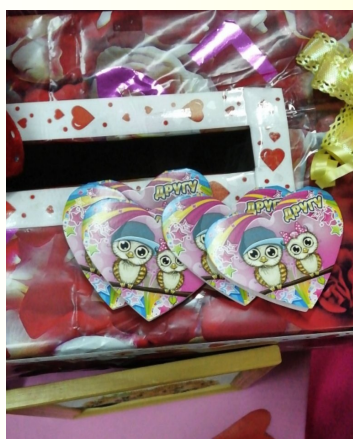
Почта Святого Валентина